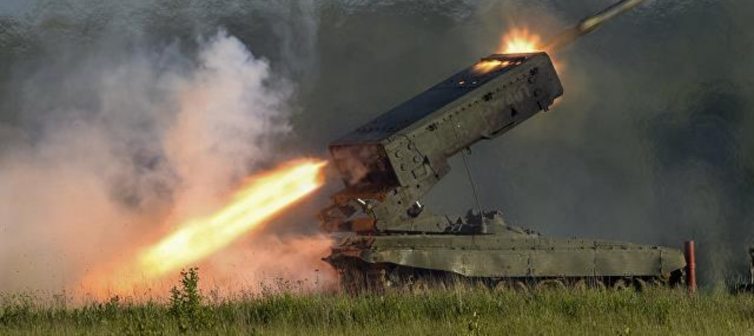
Российская тяжелая огнеметная система ТОС-1 «Буратино»