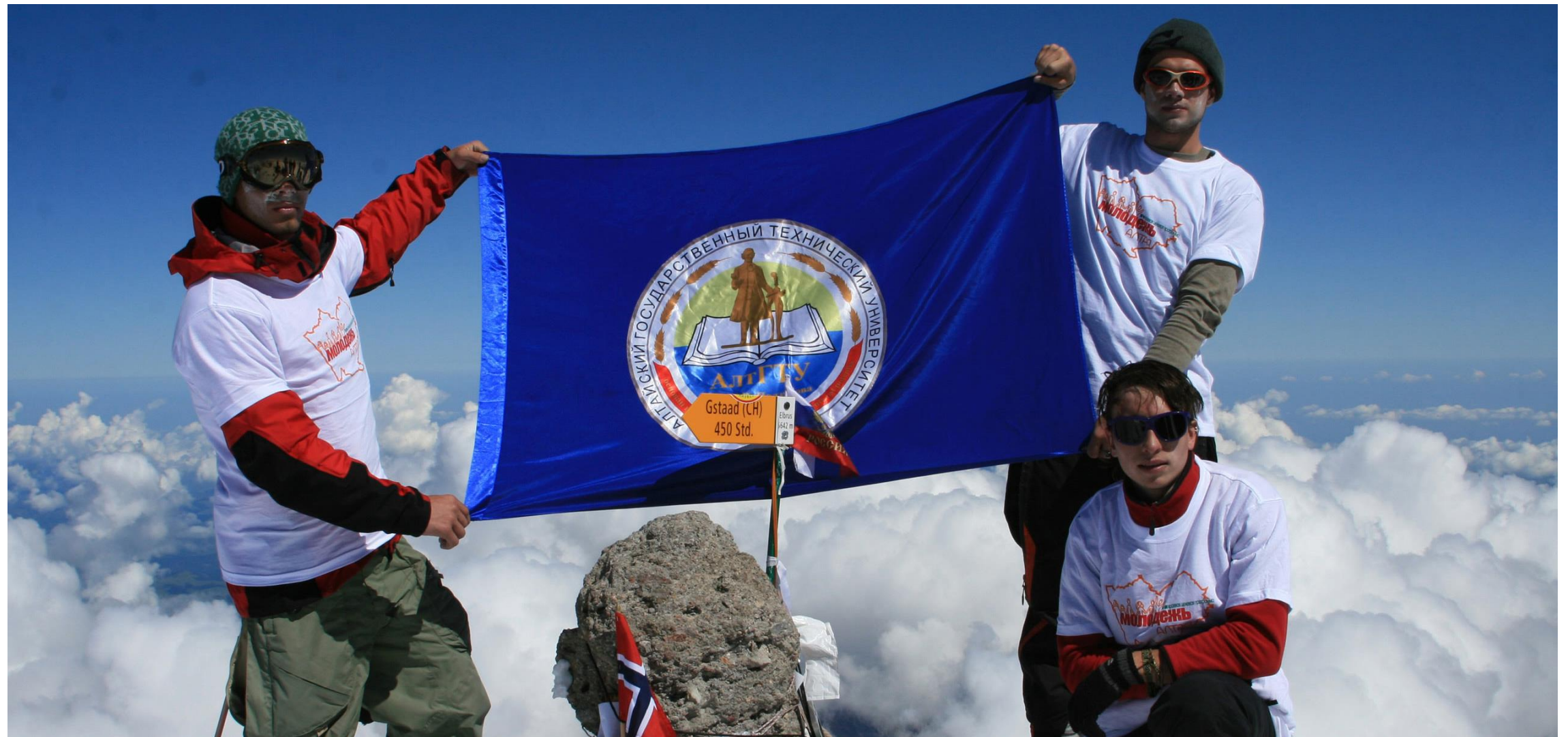
Флаг АлГТУ на вершине Эльбруса (5 тыс. 642 м), 2009 г.