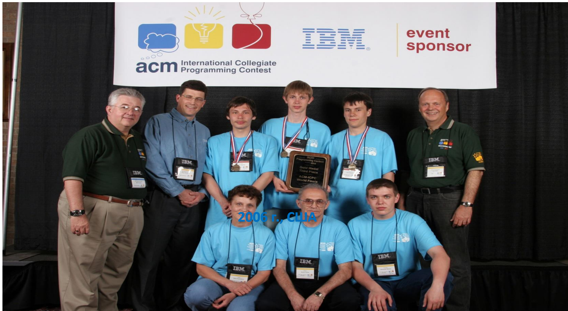
Команда АлтГУ – обладатели золотых медалей Чемпионата мира по программированию 2006 г., США