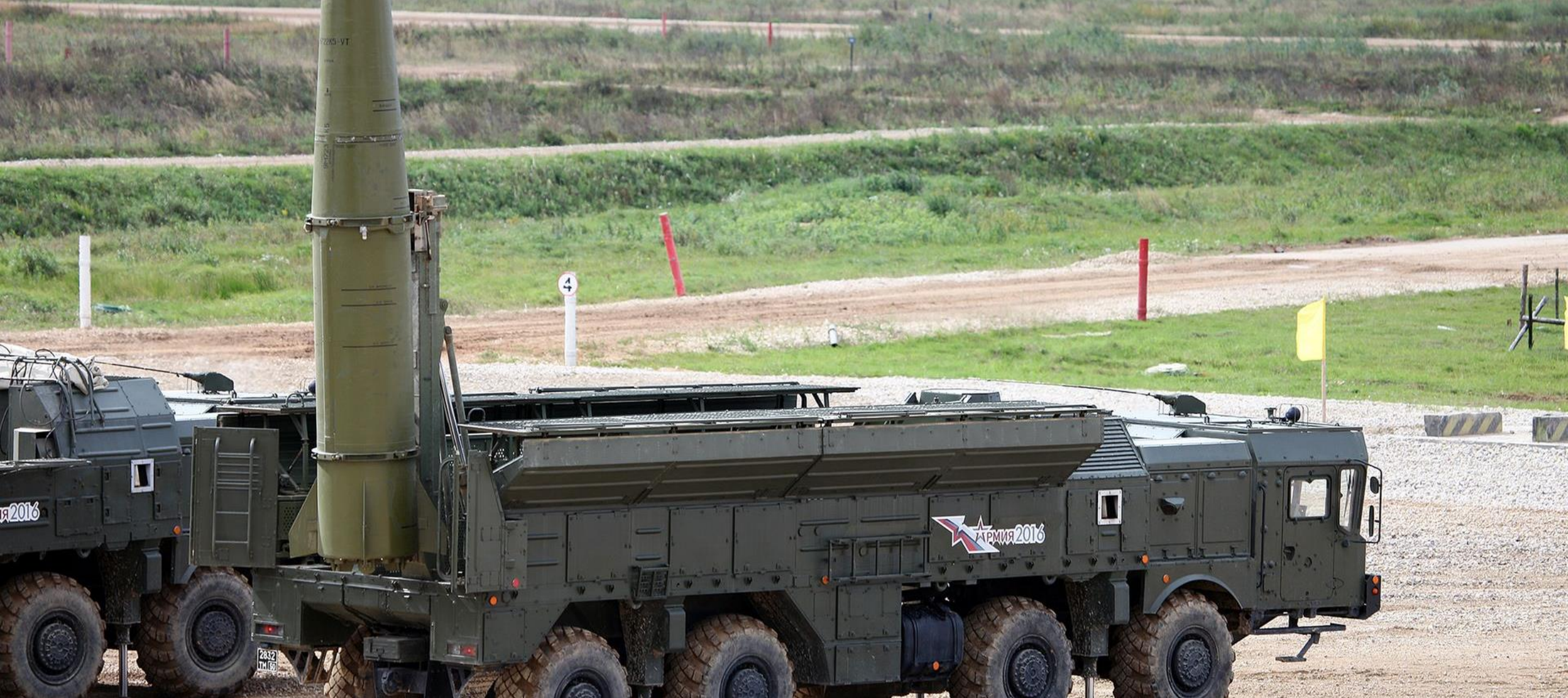
Российский ракетный оперативно-тактический комплекс «Искандер»